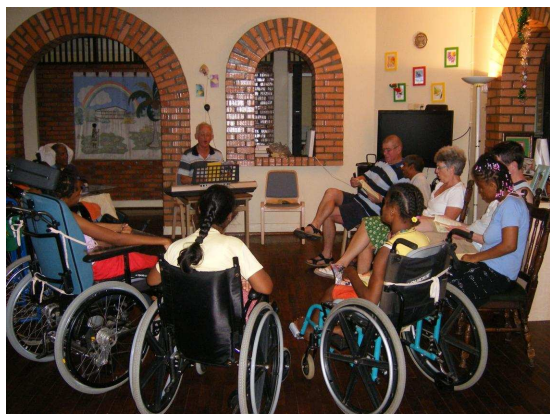
de eerste avondsluiting.

meer gehad, maar op onze eerste dag hebben we verschillende fikse buien meegemaakt. Het lekkere hier is echter, dat, wanneer het met regenen gestopt is, het zo weer lekker aanvoelt qua temperatuur.