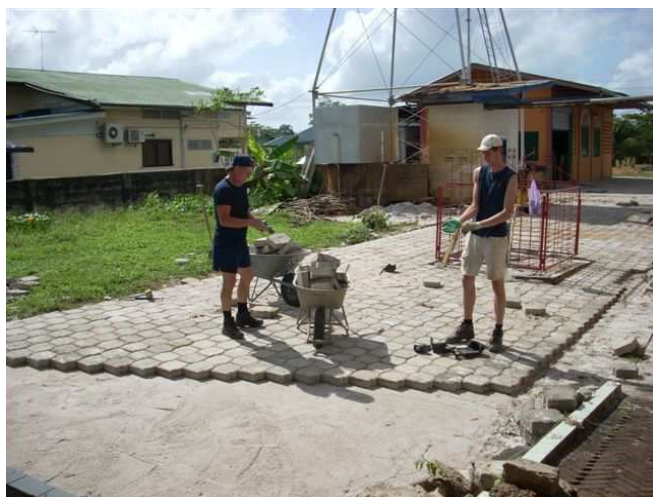
17 jauanuari 2009

De jongens staan klaar om het zware hekwerk mee te tillen. Hier ook de steiger waar we de hele dag op staan en die 's avonds mee naar huis moet.