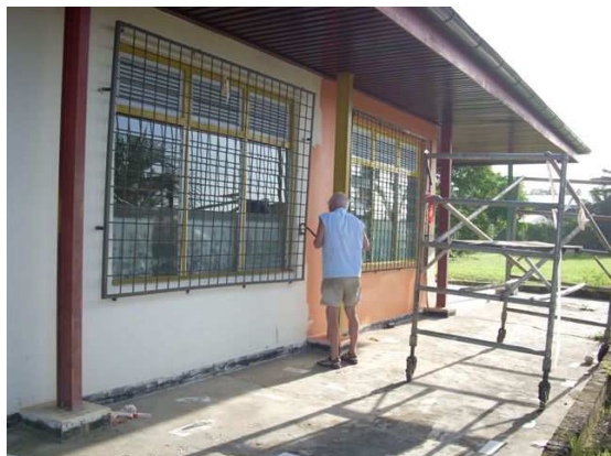
17 jauanuari 2009

Vanuit een bloedjeheet Suriname ( we hebben vandaag geen enkel buitje gehad) willen we jullie hartelijk groeten.